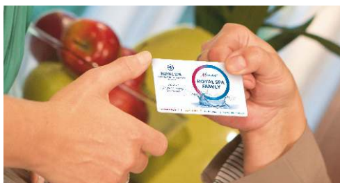
Fotografie jsou pořízeny v lázeňských hotelech ROYAL SPA